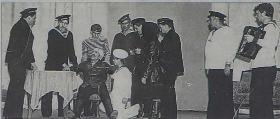
КОРНЕЙЧУК «Гибель эскадры»